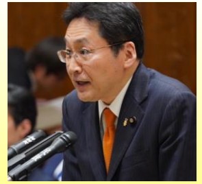
いそざき哲史 参議院議員

自動車ユーザーが積み立ててきた自賠責保険料が一般会計に繰り入れられて30年経過するが、 約5800億円が未返済 の状況。 令和7年度は補正予算と合わせて 100億円予算計上 されたが、交通事故などの被害者支援事業は 年間120～130億円 になっており、 積立金を取り崩さなければ成り立たず、安定的な運営が困難 。 現状の返済ペースでは積立金が枯渇し、被害者救済が停止する恐れがある。 国民負担が増加しないよう、早急な繰り戻しを政府に強く求める！