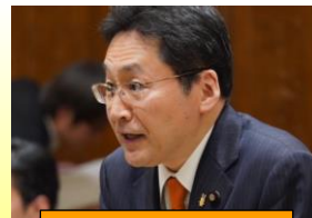
いそざき哲史 参議院議員

政府案は所得制限があり、かつ年収850万円までの中間所得者層では2年間限定措置。経営者は将来の見通しが立たなければ、賃上げを判断できない！ 中小企業の賃上げが進まなければ日本のGDP 5割超を占める個人消費の回復は限定的となる。 政府は一刻も早く生活者の手取りを増やすため、 中小企業の経営安定化や支援策 を講じるべき！